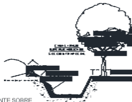
PUENTE SOBRE CANAL / RAMO IMPERMEABILIZADO SECCIÓN TRAPEZIAL